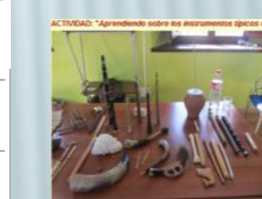
ACTIVIDAD: "Aprendiendo sobre los instrumentos típicos cántabros"