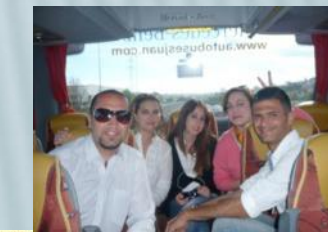
NOCHE TURCA. Una explicación de su bandera, himno y costumbres.